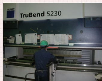
曲げ角度を計測できる角度センサー付き・ドイツ製の機械