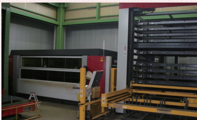
レーザー加工機を一新し、ファイバー6k・多段ストッカー・24時間稼働可能