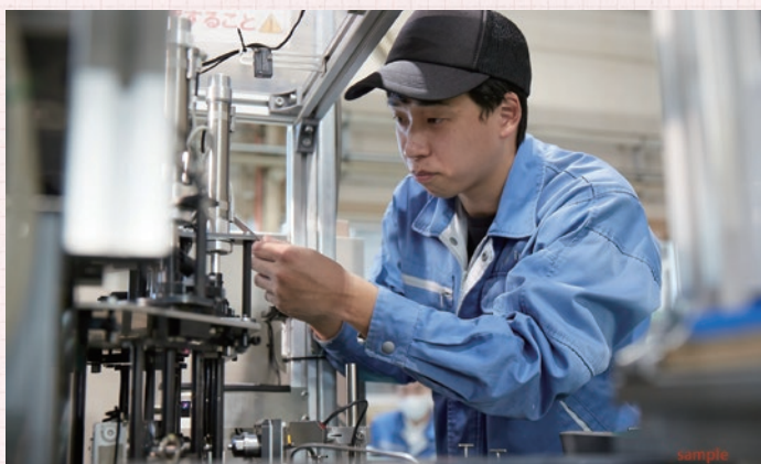
▲社内設備も自社製作し、部品製作だけでなく機械本体も製作しています。