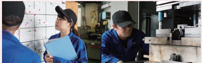
▲現場では、ベテランからのサポートを受けながら若手が活躍しています