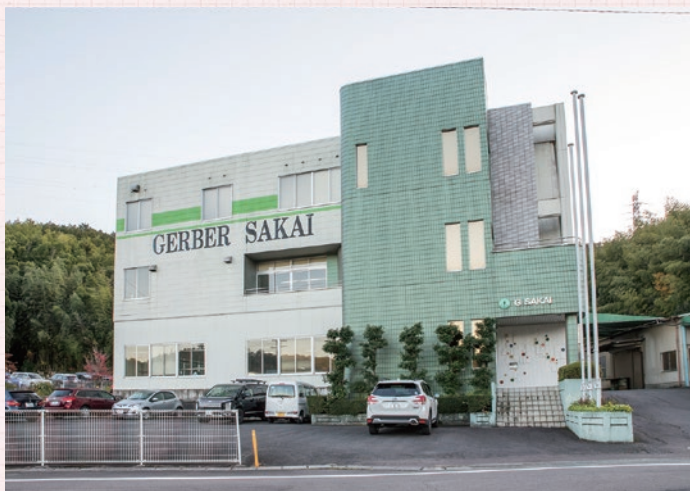
▲志津野にある本社工場。他にもレーザー加工を行う平賀工場があります。