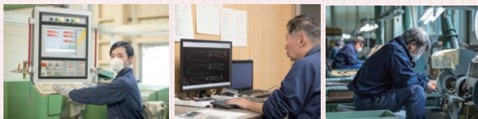
▲ベテラン職人の手作業だけでなく機械による精密加工も重要な仕事です。弊社では若者も大活躍しています。