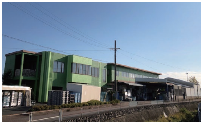
▲中央工機(株) 本社工場