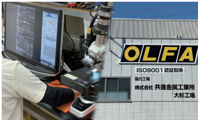
▲(株)共進金属工業所 大杉工場