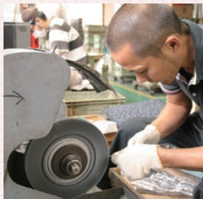
▲関の刃物の伝統を守り抜くため、職人による確かな手仕事で1本1本丁寧に包丁を製造しています。