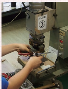
▲ハサミのカシメ作業