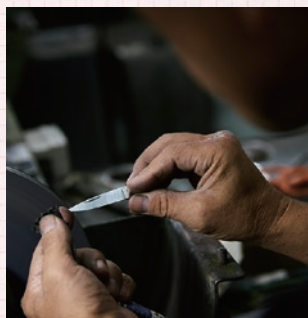
▲機械を使って部品を研ぎつける作業も慣れれば楽しいものです。