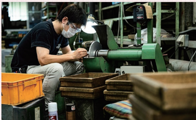
▲入社7年目になりますが今では製品の仕上りを担えるような仕事を任せられています。