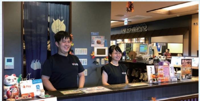
▲倉知温泉マゴの湯の管理・運営 お客様を最高の笑顔でお迎えしリラックスしてもらえるよう心がけます。