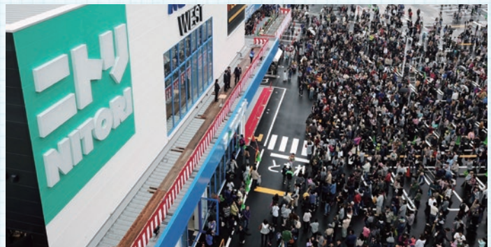
▲イベントの企画・運営 お客様にご来店いただくための販売促進イベントを開催。自分たちで考えて手作りもします。