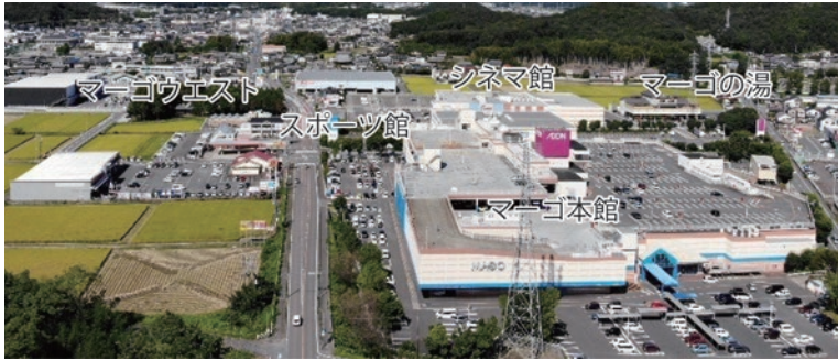
▲さらに広がるマゴタウン