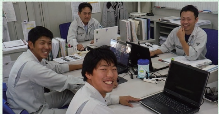
▲給料が良い 休日・休暇が取れる 希望が持てる