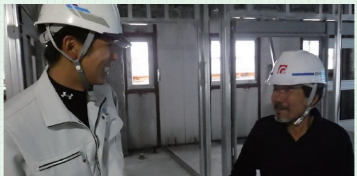
▲平成31年1月には新社屋が完成し、更に皆様のニーズに応じた建物づくりを目指しオリジナリティあふれる企画の数々をご提案していきます