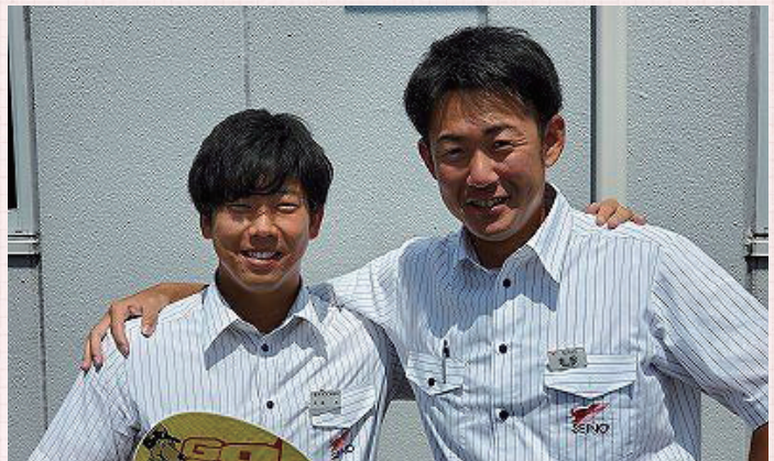
▲僕たち、同期の仲良しコンビが構内で見つけた、モノを運ぶプロたちの強い味方!をご紹介します!