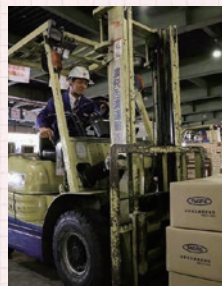
▲フォークリフトを使えば、重たい荷物も、スーイスイ。