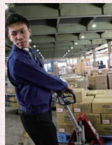
▲ハンドリフトなら、免許がなくても大丈夫♪